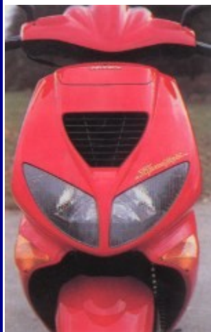
"Kocie oczy" nowego Peugeota przywodzą na myśl najszybsze motocykle klasy supersport.