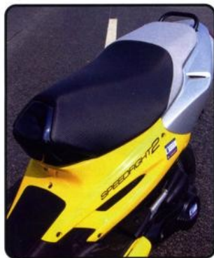
▲ Uchwyt dla pasażera wygląda tak sobie.

► Długi wahacz z przodu to niezbyt częsty widok.