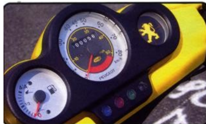
▲ Kroczący lew (po prawej) nie pozwoli zapomnieć, czym jedziesz.