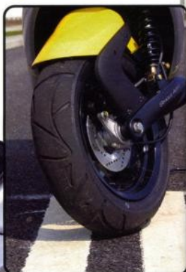
▲ Przedni hebel mógłby działać ostrzej.

↓ Do schowka zmieści się także kask integralny.